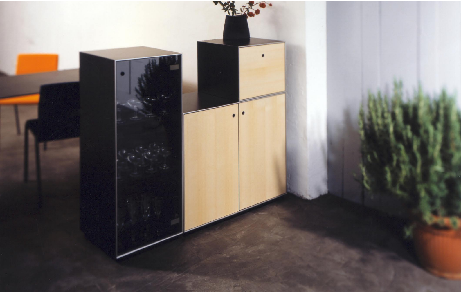
Q-bus als Raumteiler, Wohnen-Essen