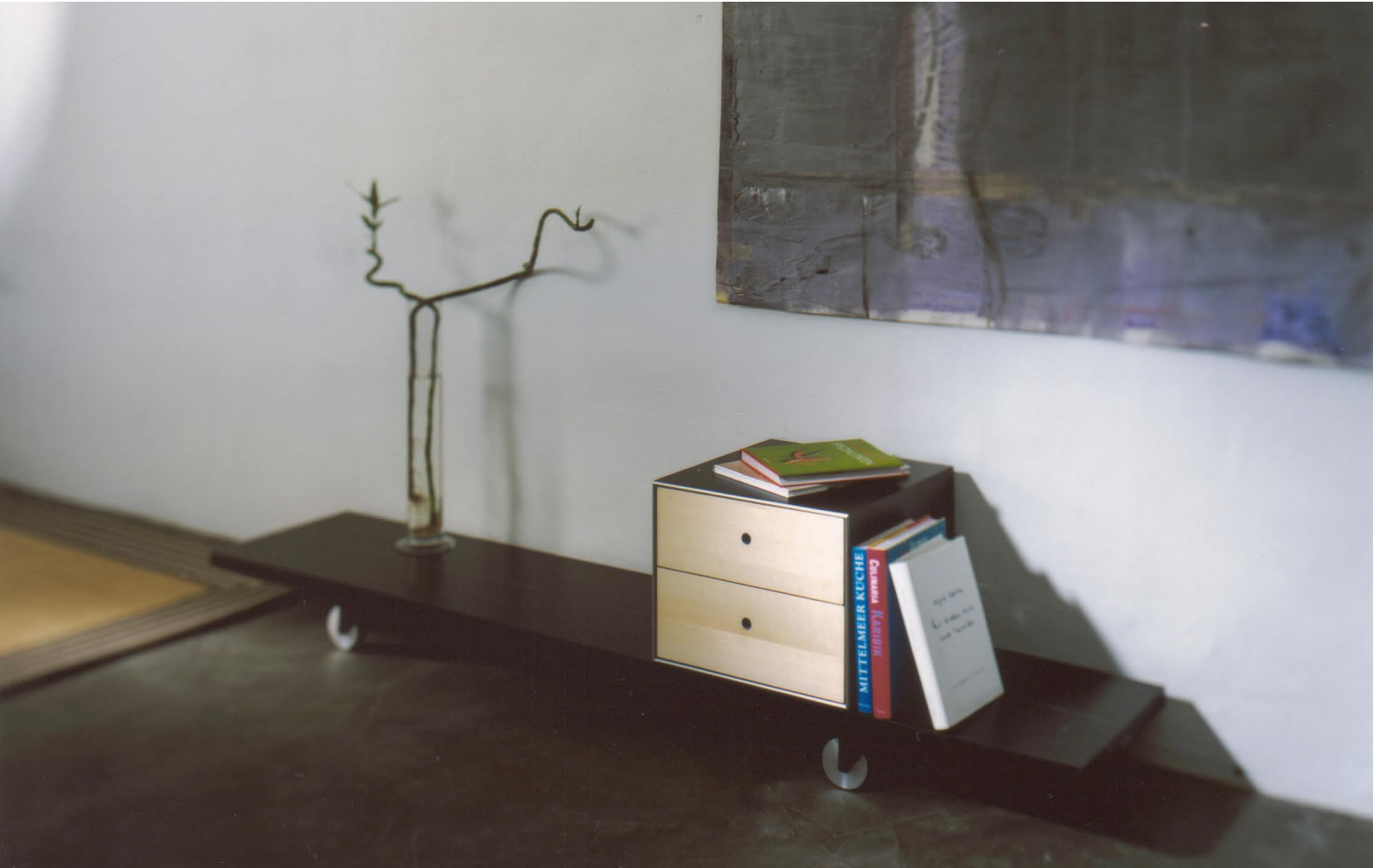
Bord auf Rollen mit Q-bus, Studio