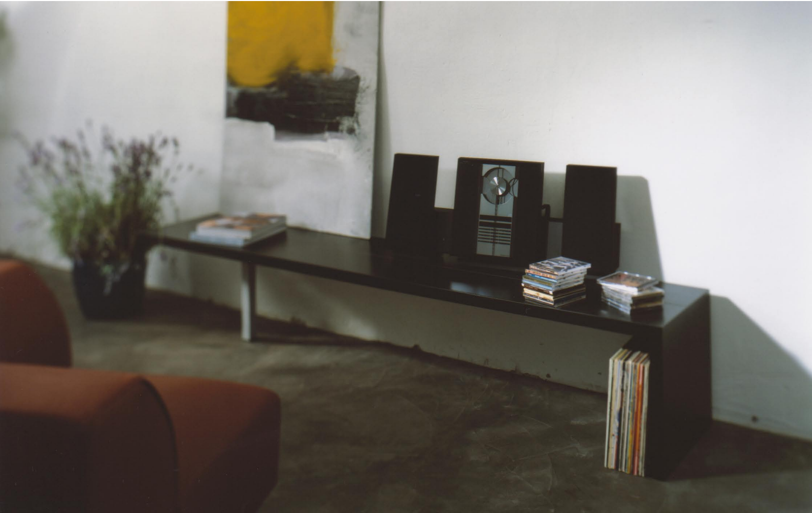
Wangenbord für Hi-Fi