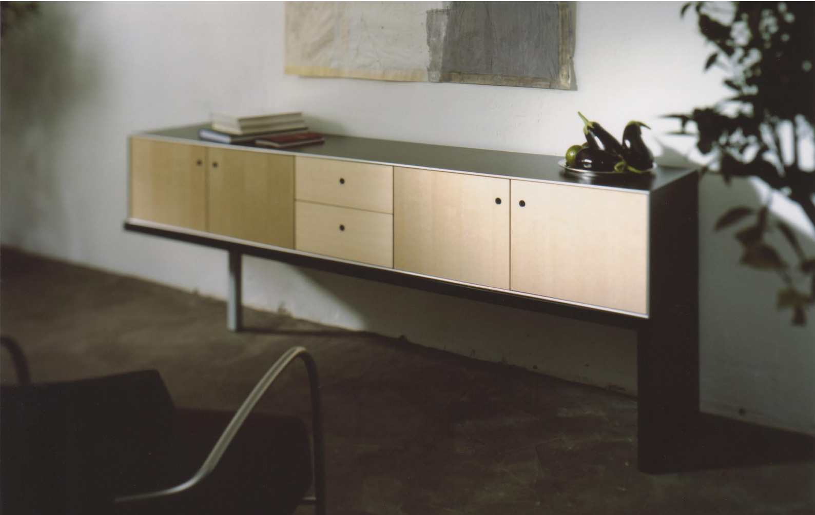
Sidebord auf Wange, Wohnen