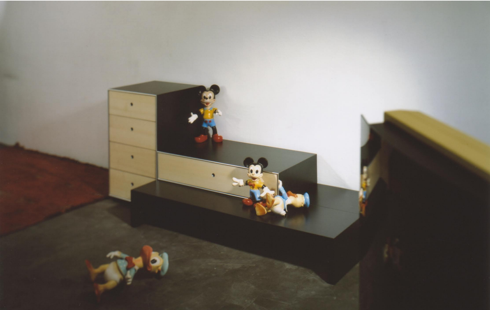
Q-bus im Kinderzimmer