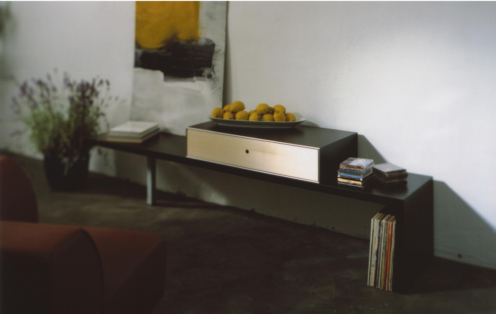
Wangenbord mit Q-bus