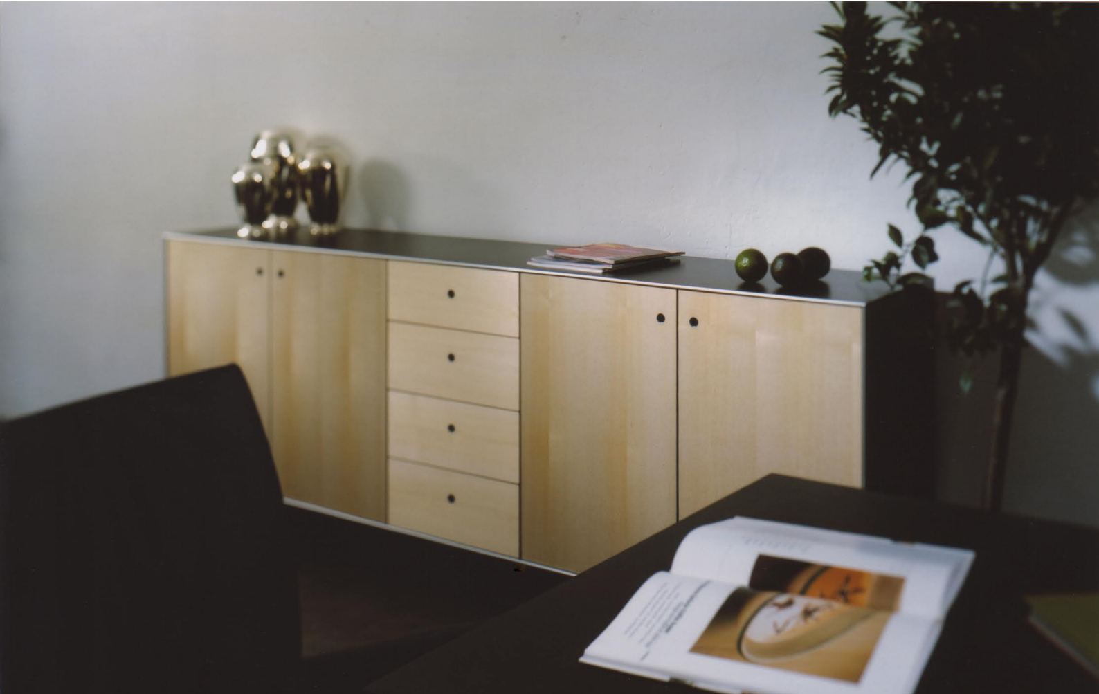
Sidebord im Essbereich